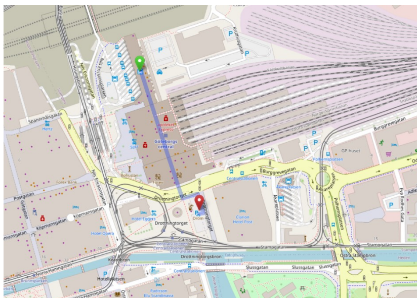
Rote Markierung auf der Karte

57°42'28.8"N 11°58'26.5"E 57.708001, 11.974014